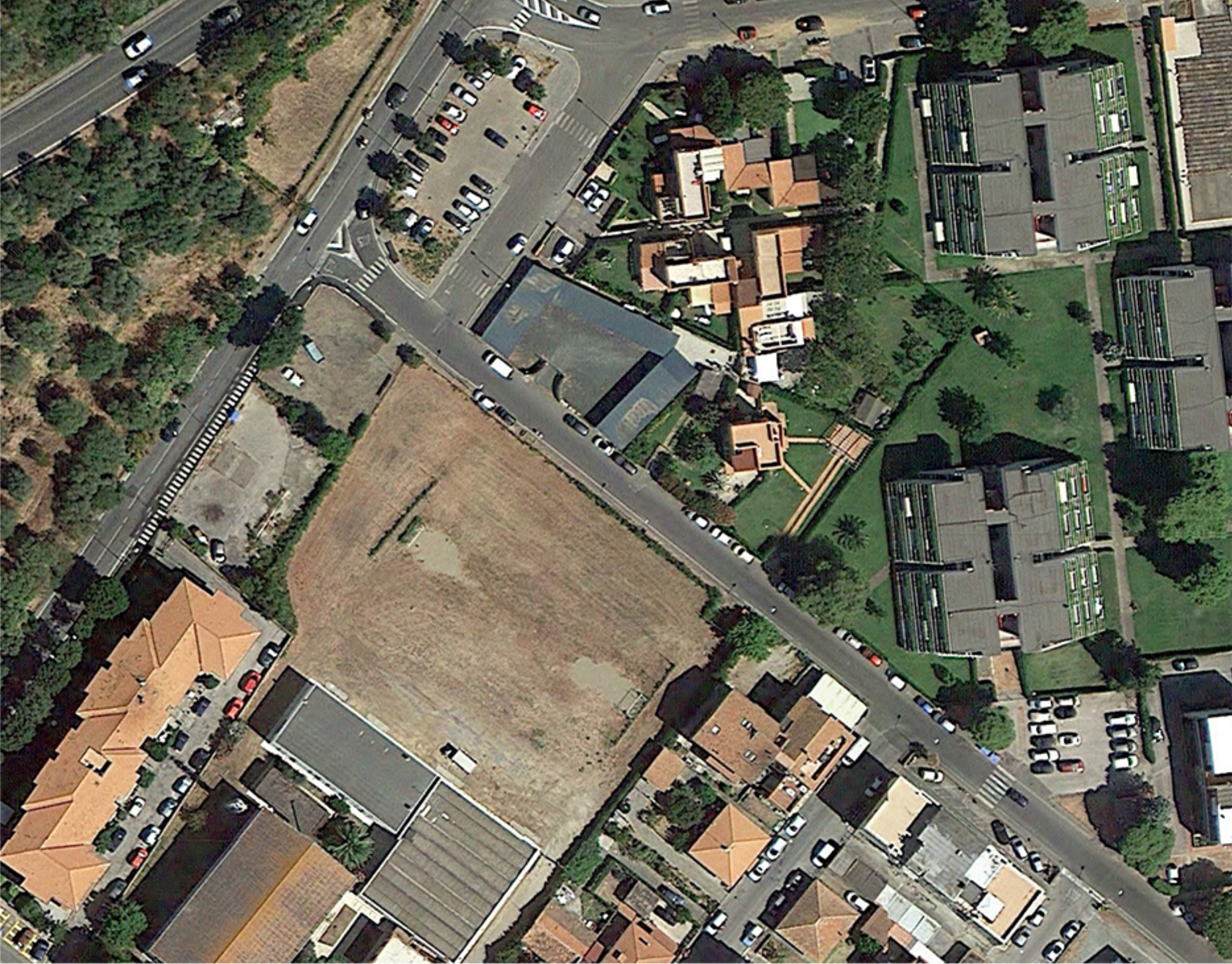
1 FOTOPERSEPOLIMENTO _ ORTOFOTO _ STATO ATTUALE