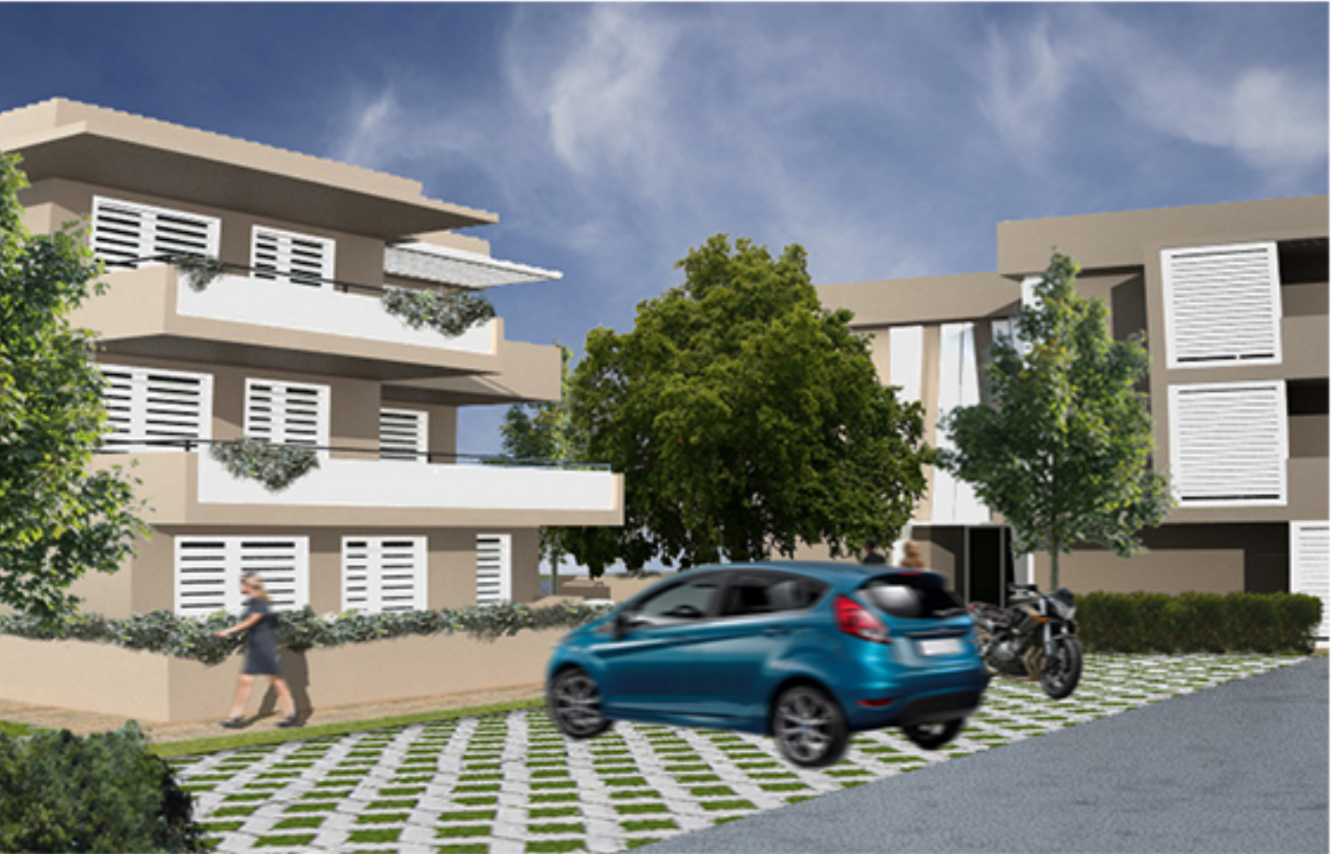
3 RENDER _ VEDUTA DA VIA XIMENES