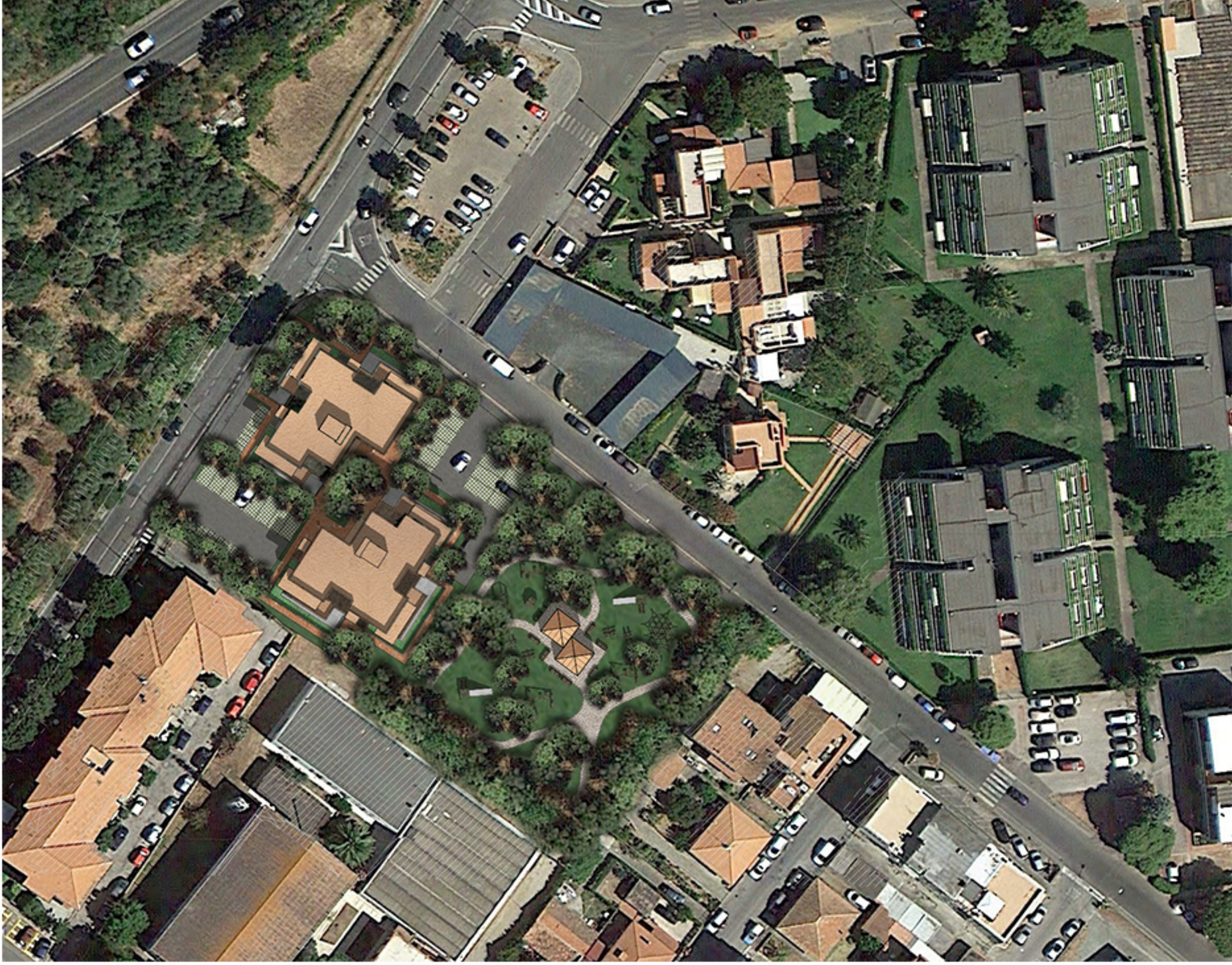
1 FOTOPERSEPOLIMENTO _ ORTOFOTO _ STATO DI PROGETTO