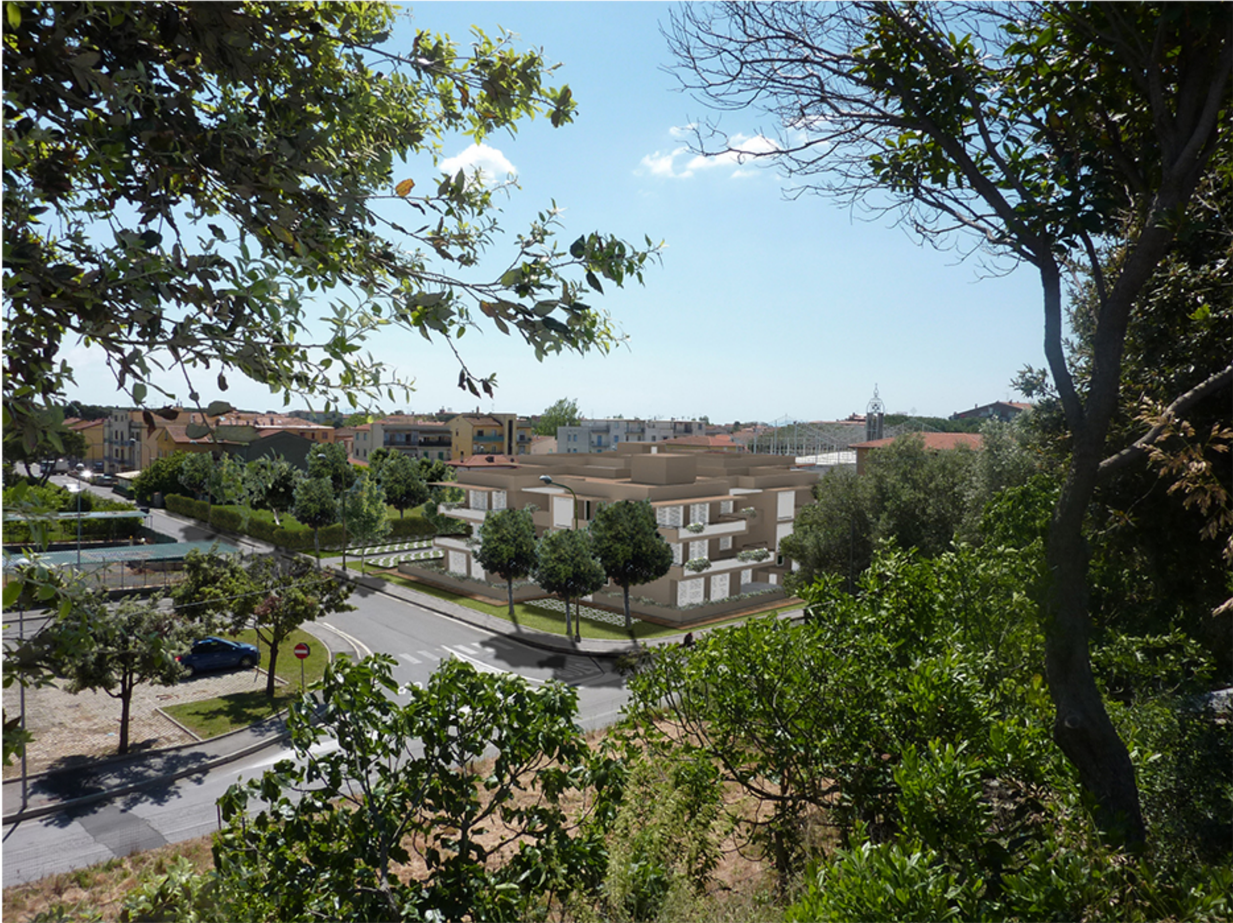
2 FOTOPERSEPOLIMENTO _ VEDUTA PANORAMICA DALLA STRADA CIRCONVALLAZIONE _ STATO DI PROGETTO