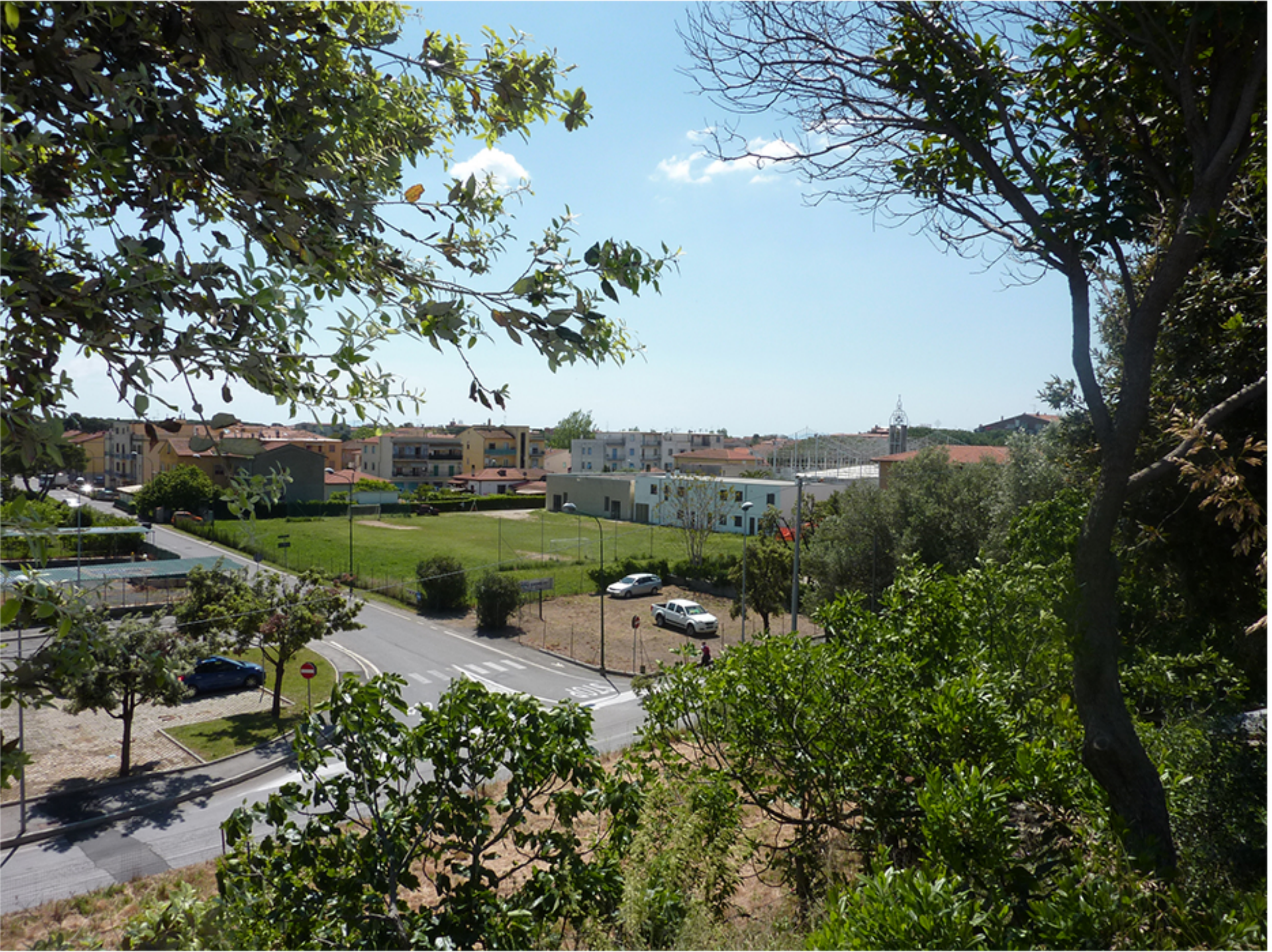
2 FOTOPERSEPOLIMENTO _ VEDUTA PANORAMICA DALLA STRADA CIRCONVALLAZIONE _ STATO ATTUALE